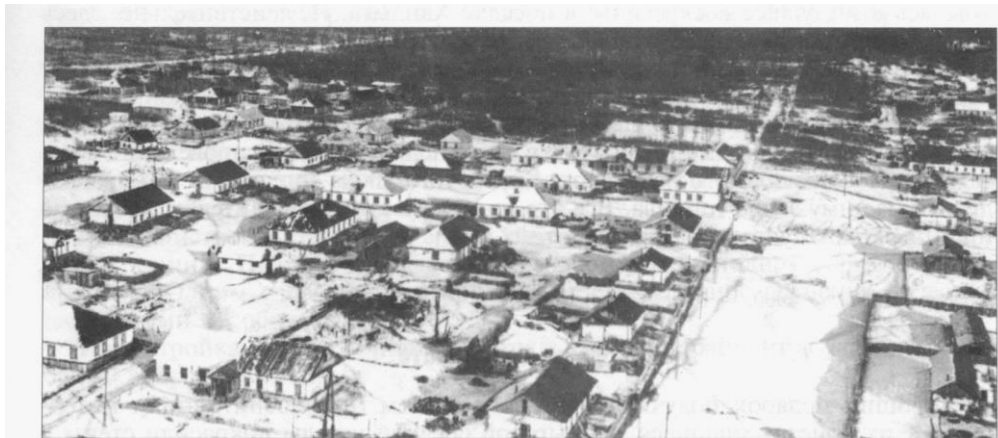
Панорама поселка Хандыга. 1961 год